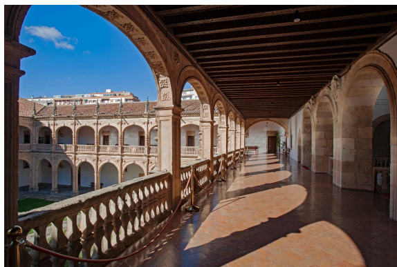
Colegio Arzobispo Fonseca