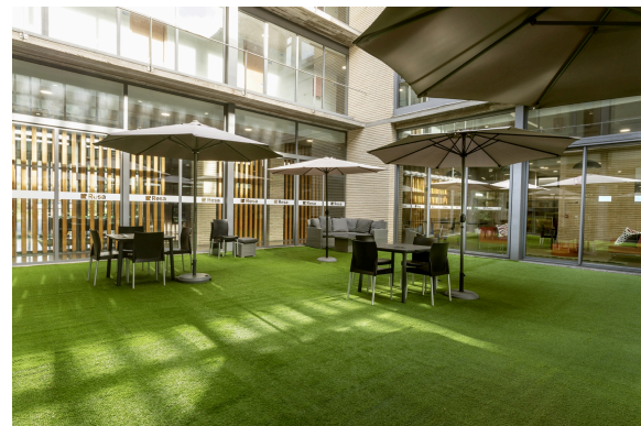
Residencia Universitaria Resa Colegio de Cuenca