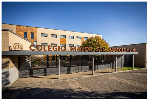
Colegio Mayor San Bartolomé