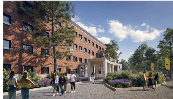
Bravo students Salamanca