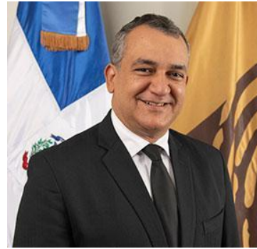
Román Jáquez Presidente de la Junta Central Electoral (JCE) de República Dominicana