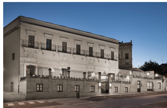
NH Hotel Salamanca