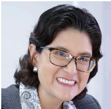
Carmen Velarde Jefa Nacional del Registro Nacional de Identificación y Estado Civil (RENIEC) de Perú