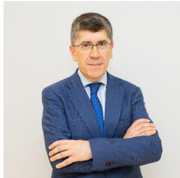
Carlos Vidal Prado Vocal de la Junta Electoral Central (JEC) de España